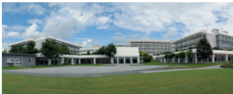
Bauherr: Berufsgenossenschaftlicher Verein für Heilbehandlung Murnau e.V., München, Deutschland Architekten: Köhler & Brinkmann, München, Deutschland Planung und Bauleitung Sanitärtechnik: IBG – Ingenieurbüro Gangl, München, Deutschland

Durch thermische Desinfektion wird der Vermeidung von Legionellen Rechnung getragen. Kaltes Wasser wird dabei auf über 70°C erwärmt und über einen bestimmten Zeitraum auf dieser Temperatur gehalten. Verzinkte Stähle sind im Bereich der Trinkwasserinstallation ungeeignet, da die Verzinkung den hohen Temperaturen an der Rohraußenfläche